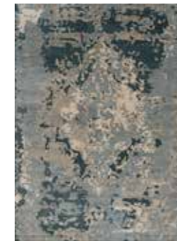
TOPKAPJ Moon blue