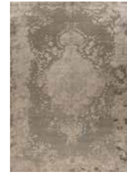
MARIE ANTOINETTE Brillant