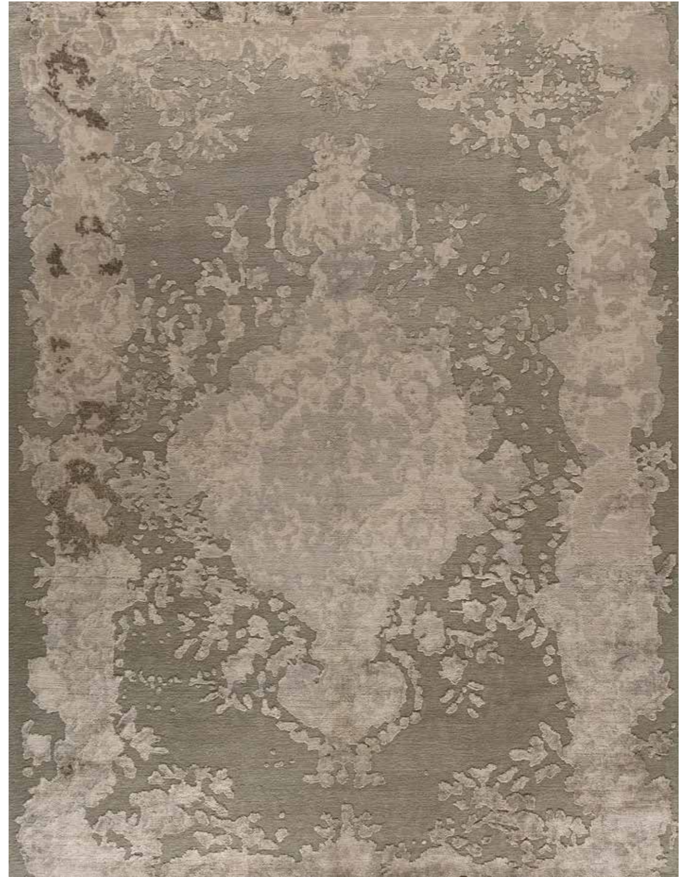
MARIE ANTOINETTE BRILLANT