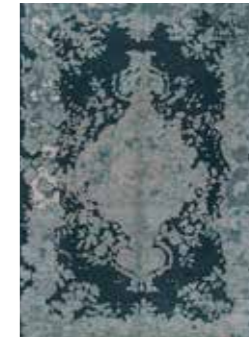
MARIE ANTOINETTE Emerald