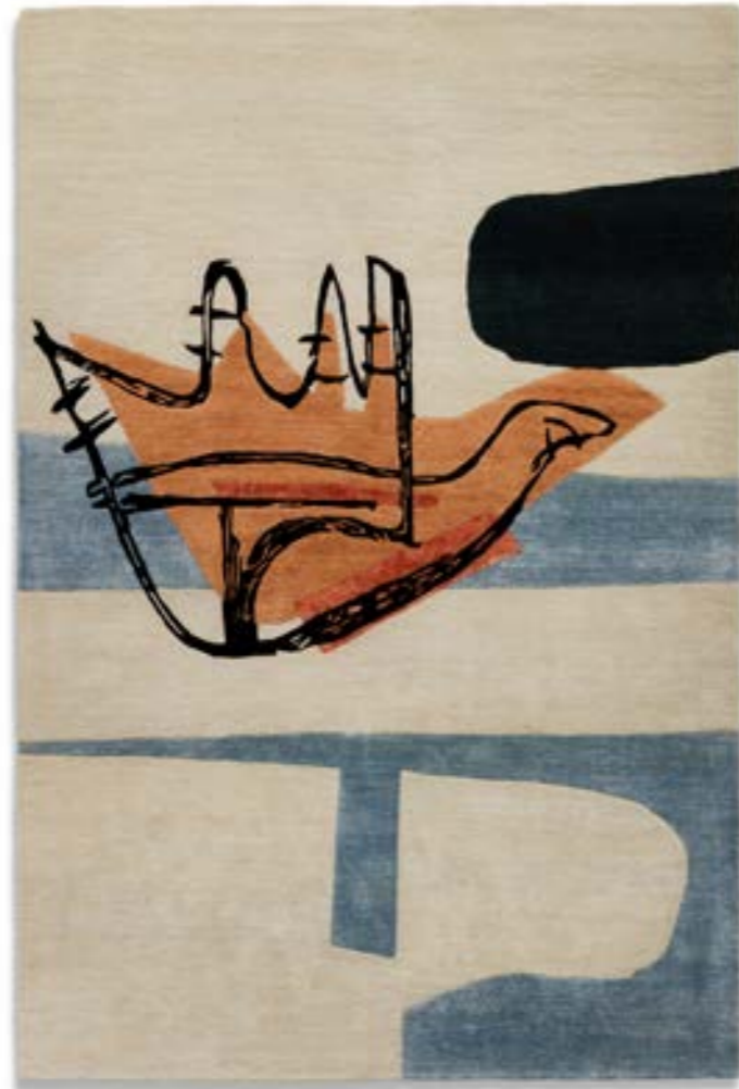
Produced Le Corbusier, 2023

Materiali: 75% lana New Zealand 25% viscosa.